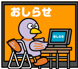
埼玉県マスコット「ロボトン」