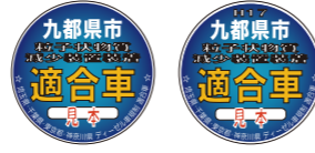
装着車両の側面などに表示します。

指定装置は、ホームページ ( https://www.9taiki.jp/ ) で公開している「指定装置の一覧」で確認できます。