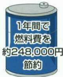
ディーゼルトラック (大型) の場合