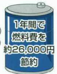
ガソリン乗用車の場合

この場合のエコドライブとは、ふんわりアクセル (トラックの場合、早めのシフトアップ+エンジン回転数を抑えた緩やかな発進) と、信号待ちアイドリングストップなどです。