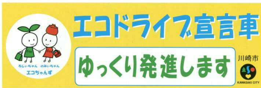
エコドライブ宣言ステッカー

http://www.city.kawasaki.jp/kurashi/category/29-1-8-5-0-0-0-0-0-0-0.html